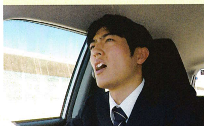
イライラしてあまり熱くなりすぎると取り返しのつかない大やけどを……