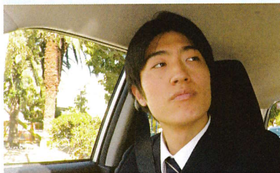
安易に生活道路を走ると事故を起こす可能性が高くなる。