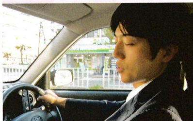
交通事故の背後には、油断や思い込みが潜んでいる事が多い。